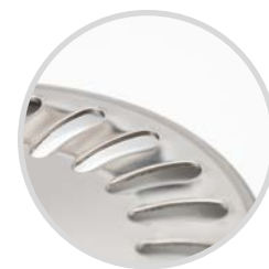
nerezová mřížka 1,5 mm